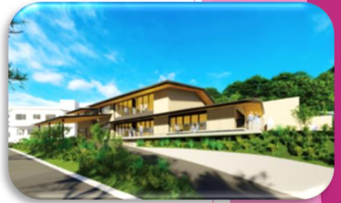
新施設イメージ図